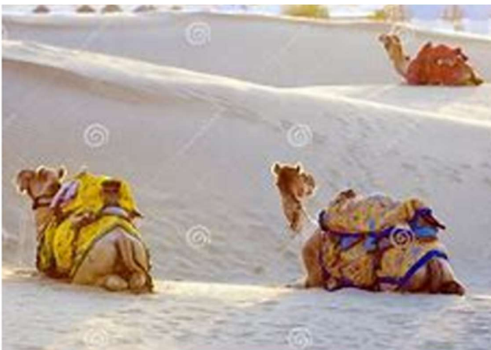
Kamelen in de woestijn van Thar Jaisalmer, India